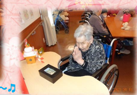
今年も良い年でありますように～♪